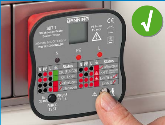
Steckdose korrekt installiert, Fingerkontakt prüft PE-Kontakt auf gefährliche Berührungsspannung.