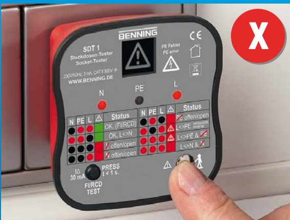
Steckdose mit Verdrahtungsfehler, Lebensgefahr! Außenleiter (L) und Schutzleiter (PE) wurden vertauscht!