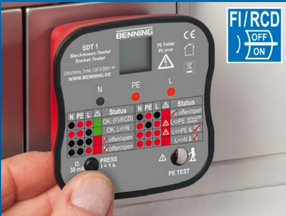
Prüfung der Auslösefunktion eines 30 mA FI/RCD-Schutzschalters durch Betätigung der Prüftaste.